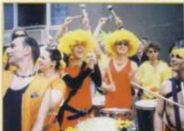
„Surdo und Gomorrha“ trommeln lautstark auf dem Stadtfest

Wie durch Zauberei fügen sich die mitreißenden Rhythmen aneinander. Dass "Surdo und Gomorrha" sowohl mit- als auch hirtreißend sind, haben sie in ihren unzähligen Auftritten mehr als hinreichend bewiesen.