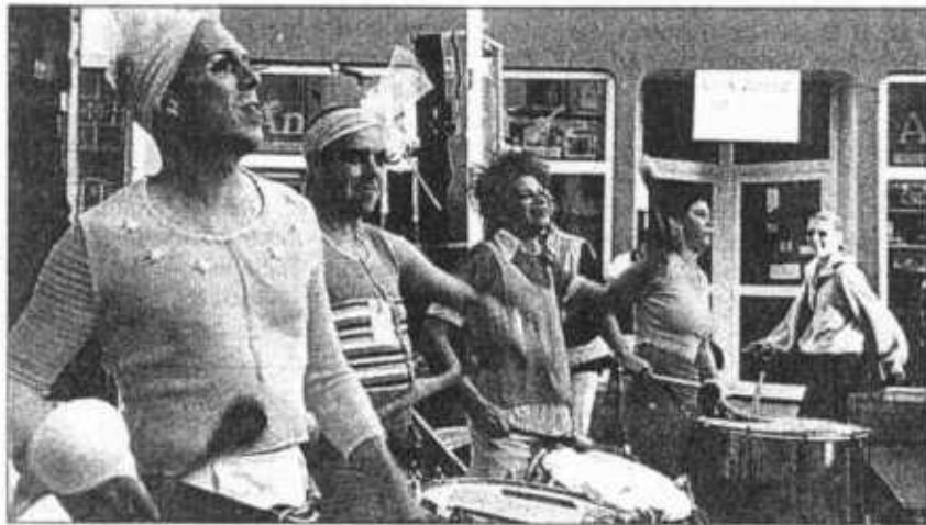
„Surdo und Gomorrha“ trommelten, was das Zeug hielt.